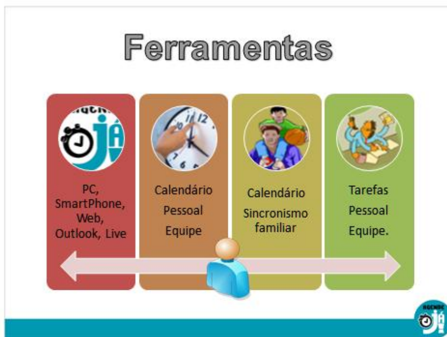
Figura 3: Slide pronto

Utilizo o WordArt e gero o título: Ferramentas e, com dizem os franceses: “Voilà”, veja o slide pronto (figura 3).