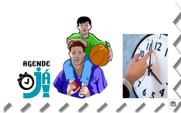
Figura 2: Como editar e inserir as figuras nas molduras da figura 1?

Decido usar o logo do portal Agende Já e alguns Clips Arts (figura 2).